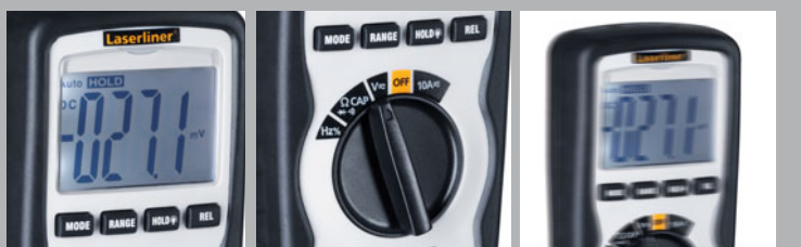
Groot, verlicht display